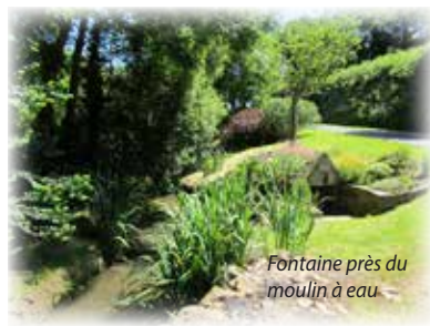
Fontaine près du moulin à eau.

8 Retour au hameau de Saint-Adrien autrefois très vivant. La bâtisse qui fait l'angle était il y a encore une vingtaine d'années un bar-épicerie. Surnommé « le Casino », il était tenu par Yvonne Morel, une figure locale.